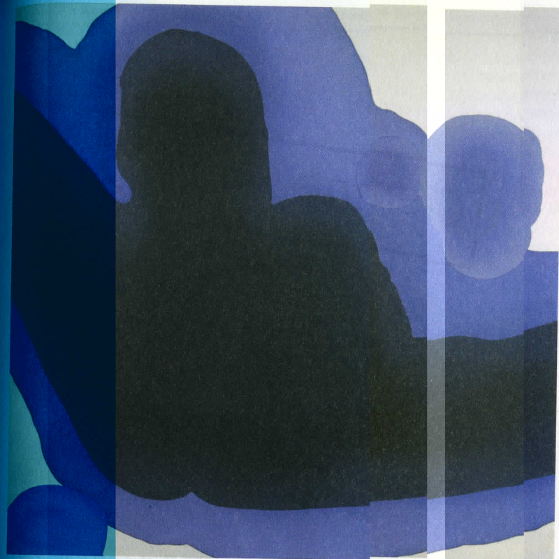
Malgorzata Szymankiewicz: Bez tytułu 86, 2008, akryl na płótnie, 150 x 150 cm kopia

i do- Przede niej ade- nych zja- wacać je się ale, wy- właś- kich wy- ktyce nami. y ra- uden- ze. To fuka- e ona tu. elację bar- odcho- w indy- my się edy- ozma- Oczy- ównie by świa- do- mieli uż rzy- po dł- nych my czesz h e róż- wady żeby a rak- nych. zu, nacjał, ja- nk- od- ne a. ej